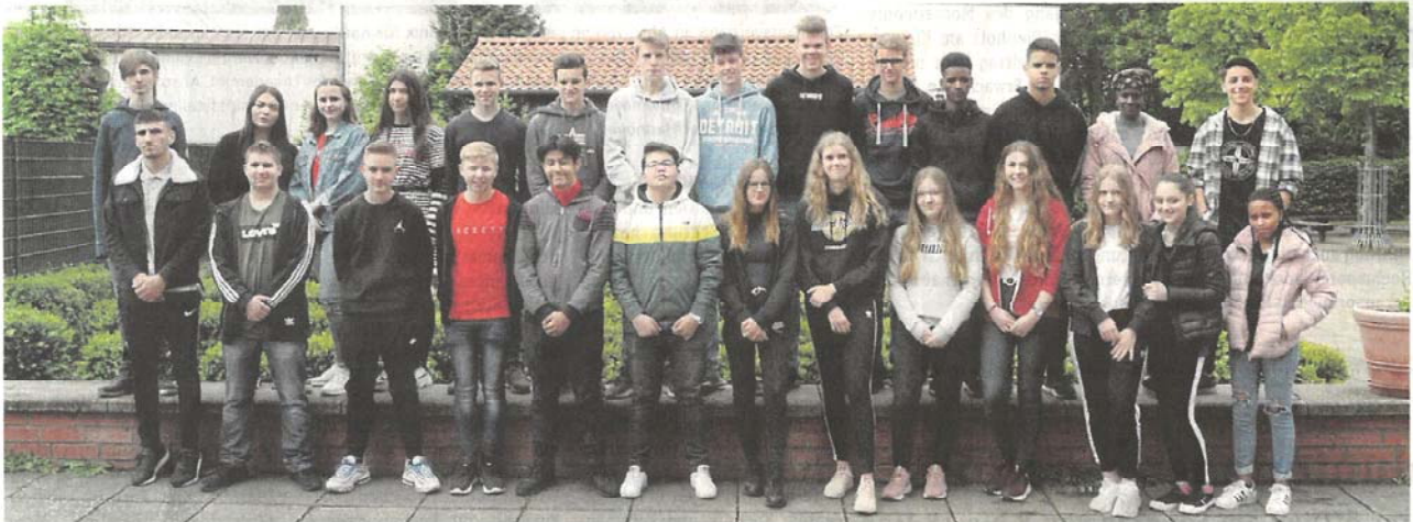
Haben in diesem Jahr wieder die Chance, Ausbildungsberufe und -betriebe aus der Region kennenzulernen: Schülerinnen und Schüler der Klasse 9a der Lemförder Von-Sanden-Oberschule.

› Lemförder Schnuppertage gehen in diesem Jahr in die fünfte Runde