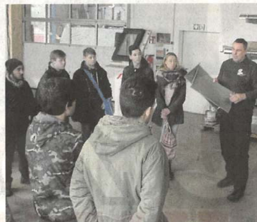
Die einzelnen Betriebe stellten sich den Schülerinnen und Schülern vor.